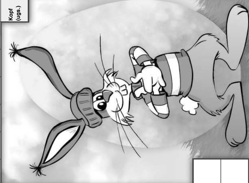
Illustration: © Trummer/DEIKE